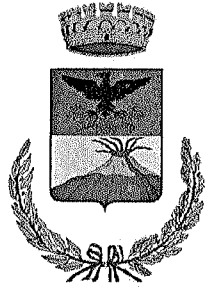
COMUNE DI ZAFFERANA ETNEA